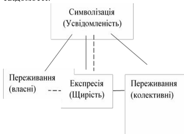
Рис. 2 Модель інконгруентності експресії лідера.

довіри залежить від глибини усвідомлення лідером власного стану. Ситуації, в яких лідер обманює своїх виборців, потенційно є більш керованими і контрольованими, аніж ті, де лідер обманює також й себе, тобто переривається зв'язок переживань та експресії з їхньою символізацією у свідомості.