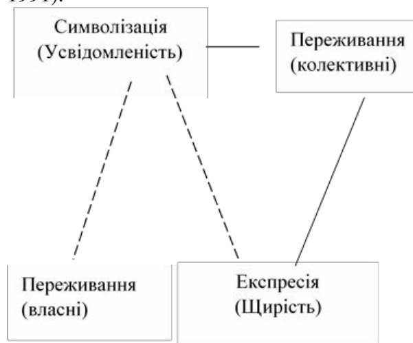
Рис. 3 Модель інконгруентності переживань лідера.

По-перше, ми маємо прийняти той факт, що подібні конфлікти є не виключенням, а правилом політичної діяльності, і, як будь які конфлікти між приватним і колективним, особистісним і груповим, вони лежать в основі людської соціальності як такої. У рамках людиноцентрованого підходу соціальні та політичні інститути розглядаються як ворожа до особистості сила, що блокує її самоактуалізацію та спонукає до засвоєння інконгруентних способів соціальної поведінки (Caspary, 1991).